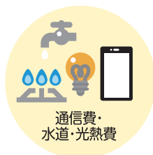
通信費・ 水道・光熱費