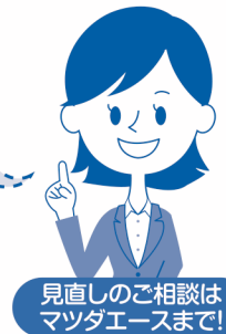
見直しのご相談はマツダエースまで!